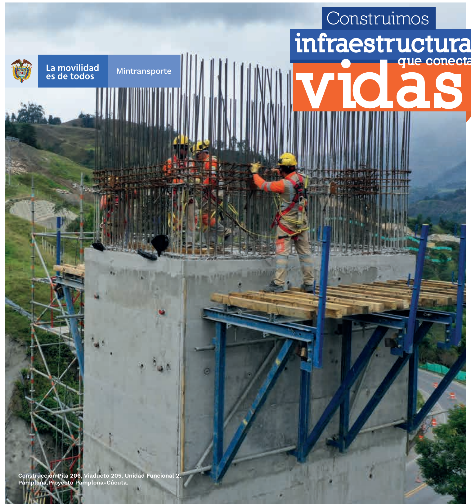
Construcción Pila 206, Viaducto 205, Unidad Funcional 2, Pamplona, Proyecto Pamplona-Cúcuta.

En el municipio de Los Patios, la Navidad inicia con el Festival Folclórico y Cultural de la Identidad Patiense. Eventos sociales, culturales, deportivos y una lista de grandes conciertos se destacan cada año en este festival.