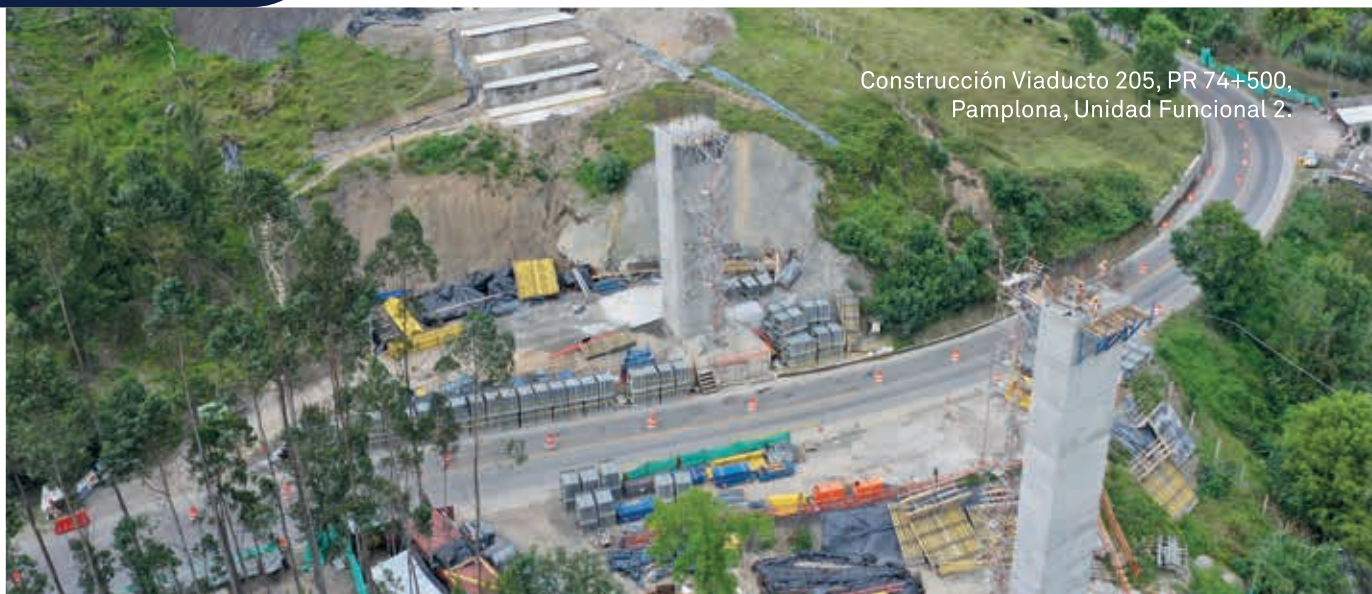
Construcción Viaducto 205, PR 74+500, Pamplona, Unidad Funcional 2.