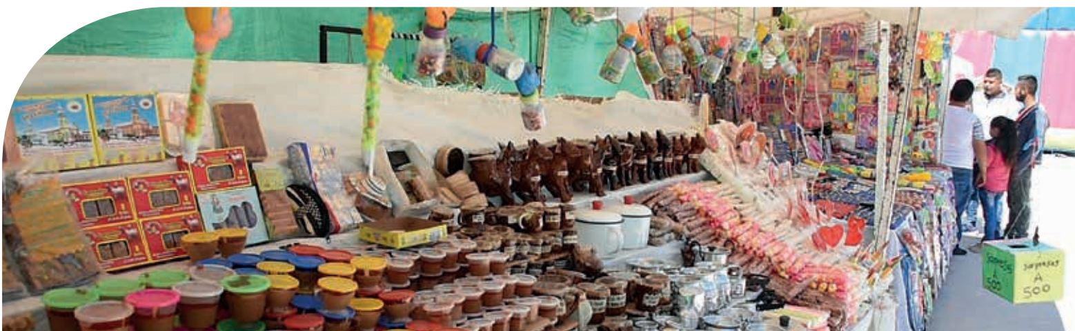
En junio se realiza la Feria Internacional Pamplonesa.

Las festividades que cada año celebran los municipios de nuestra área de influencia son siempre una buena época para realizar turismo en la región, dado que es la mejor oportunidad para conocer las tradiciones y la cultura de sus habitantes y compartir momentos de alegría y música. Por esto, recopilamos los meses en los que se celebran sus festividades.